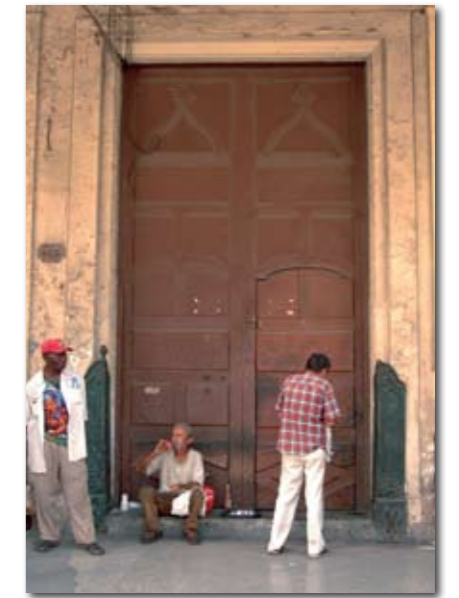
Die Haupttür des Gebäudes ist eher schmucklos und stammt wahrscheinlich aus einer späteren Zeit.

Wie es scheint, hat Fonseca dieses Gebäude selbst errichten und im Jahr 1910 einweihen lassen. Ein Hinweis an der Außenseite des Gebäudes ist aufgrund des maroden Zustands der Mauern längst nicht mehr lesbar, sollte dort einmal einer gewesen sein. Doch das Gebäude